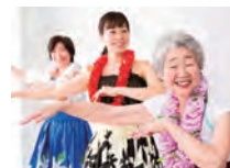
癒しのフラダンス