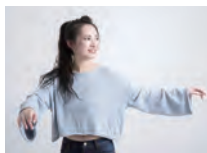
気分は社交ダンス♪

世界各國のダンスを堪能しよう!! はじめてでもチャレンジできるクラスばかりです! お好みに合わせてご参加ください。